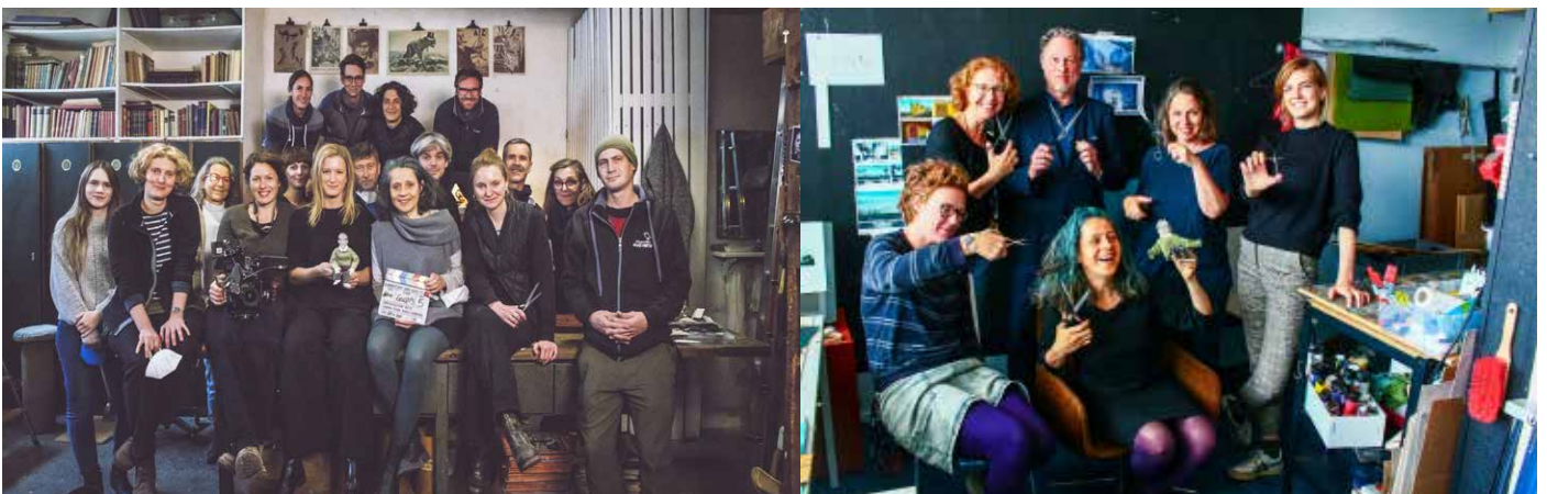
Left: team live action Vienna, right: visit Studio Cou-out-Animation Berlin

Förderungen: BKM, Medienboard Berlin Brandenburg, Filmförderungsanstalt, DFFF (D)/ Österreichisches Filminstitut, Fisa, Filmfonds Wien (A)/ BAK, Zürcher Filmstiftung, Studienbibliothek (CH) Sender: RBB, Arte, SRF